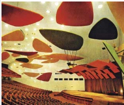
Aula Magna de la Universidad Central de Venezuela, cuyo cielorraso muestra Platillos voladores , obra de Alexander Calder.