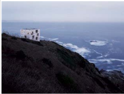
La casa Poli se levantó sobre un acantilado en península chilena de Coliumo.