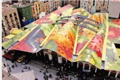
Mercado Santa Caterina, de los arquitectos Enric Miralles y Benedetta Tagliabue.